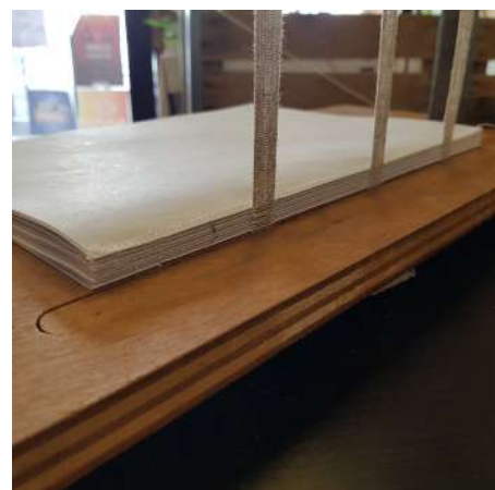
Couture sur rubans après surjet pour une meilleure tenue dans le temps