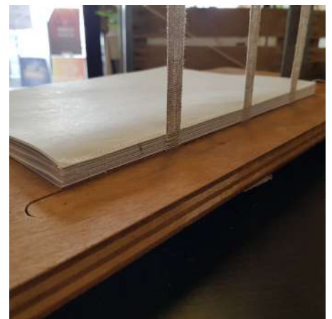
Couture sur rubans après surjet pour une meilleure tenue dans le temps